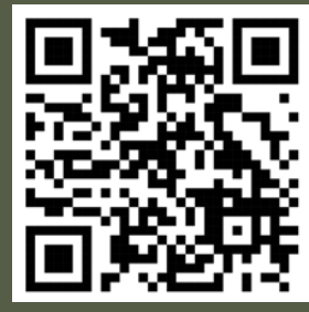
تحميل البروشور وشروط المزاد